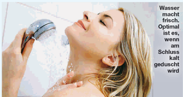
Wasser macht frisch. Optimal ist es, wenn am Schluss kalt geduscht wird

■ Trick 7: Warmes Wasser trinken Nach sechs bis acht Stunden Schlaf fehlt dem Körper Flüssigkeit. Trinken Sie deshalb jeden Morgen gleich nach dem Aufstehen ein großes Glas warmes Wasser – das regt die Verdauung und den Zellstoffwechsel an. Der Körper kann loslegen – und Sie auch!